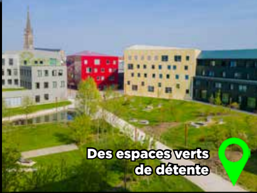
Des espaces verts de détente