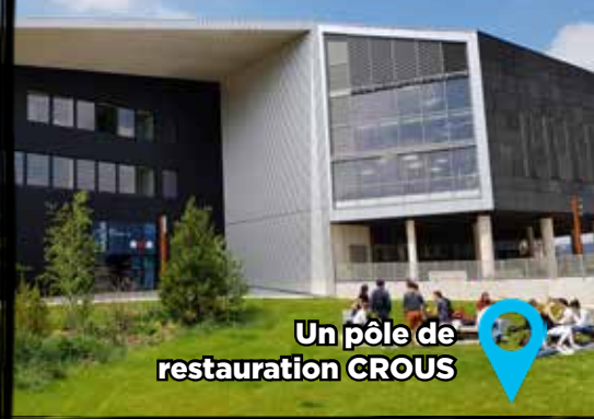
Un pôle de restauration CROUS