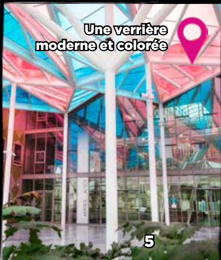
Une verrière moderne et colorée