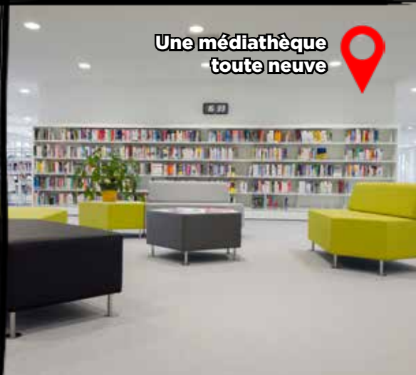
Une médiathèque toute neuve