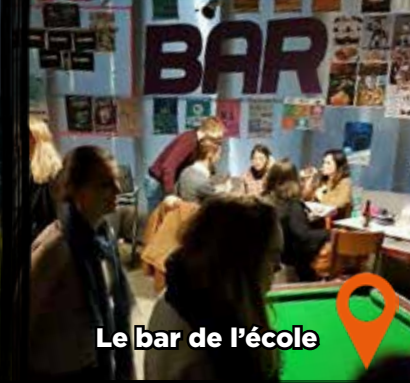
Le bar de l'école