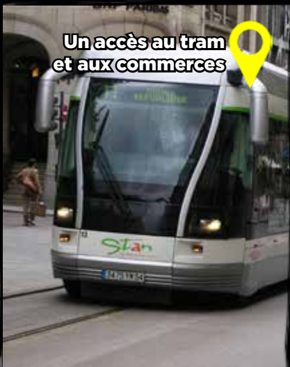
Un accès au tram et aux commerces